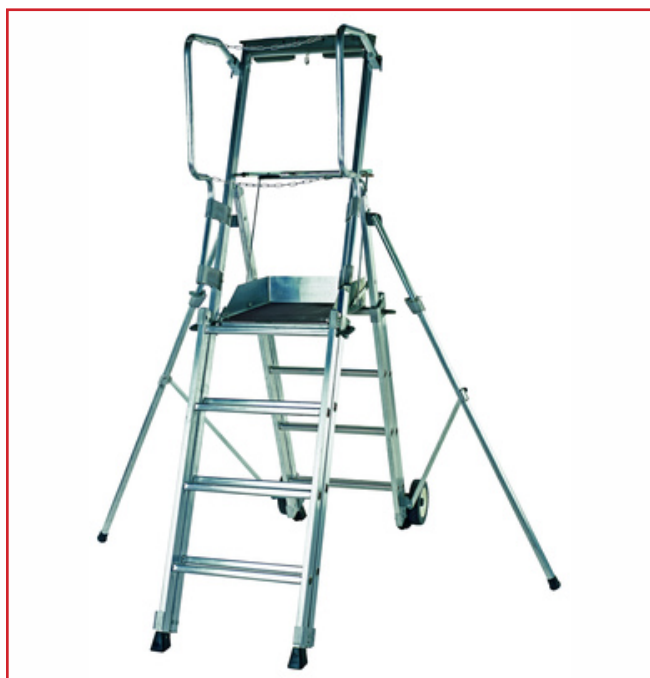
PLATE-FORME DE TRAVAIL TÉLESCOPIQUE PL SCOP