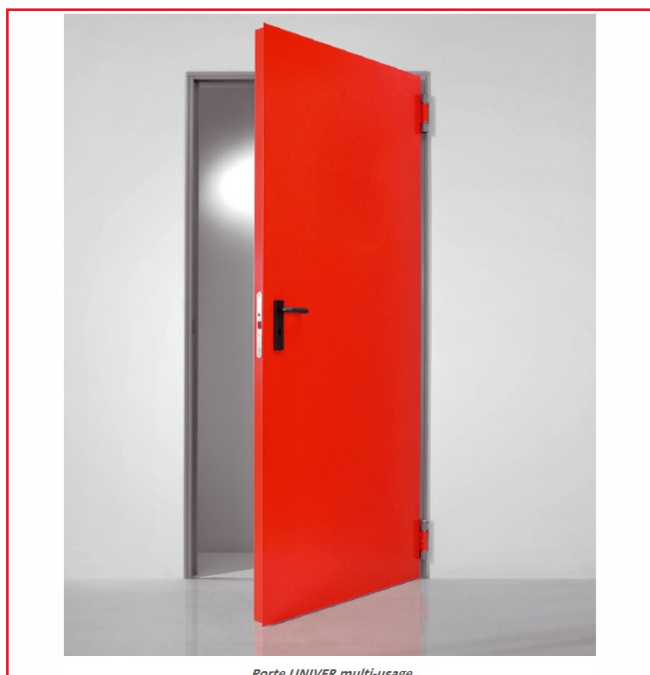
Porte UNIVER multi-usage