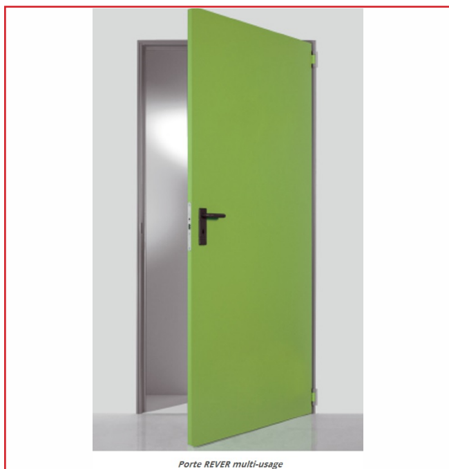
Porte REVER multi-usage