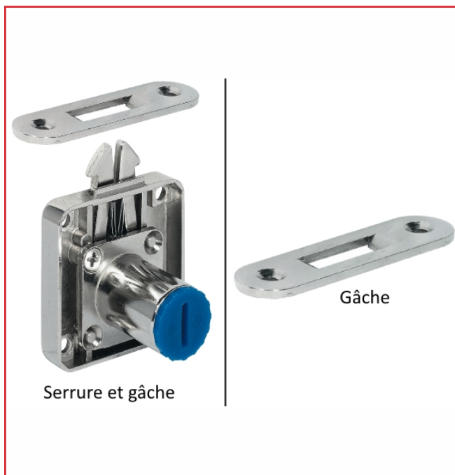
Serrure et gâche