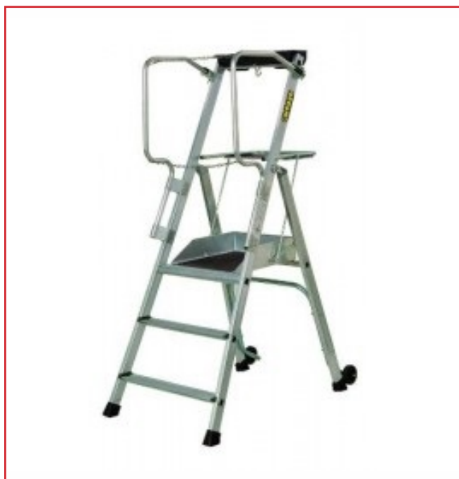
PLATE-FORME ROULANTE PL3 ET PL4