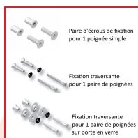
Paire d'écrous de fixation pour 1 poignée simple