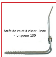
Arrêt de volet à visser - inox - longueur 130