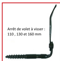
Arrêt de volet à visser : 110 , 130 et 160 mm