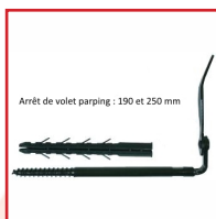
Arrêt de volet parpaing : 190 et 250 mm