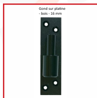
Gond sur platine - bois - 16 mm