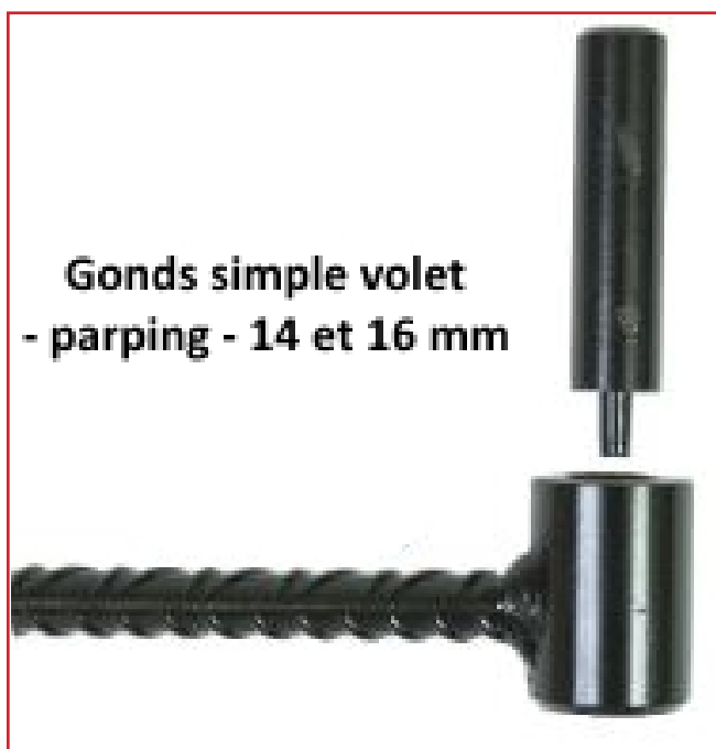
Gonds simple volet - parping - 14 et 16 mm