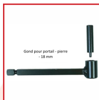
Gond pour portail - pierre - 18 mm