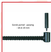
Gonds portail - parping - 18 et 20 mm