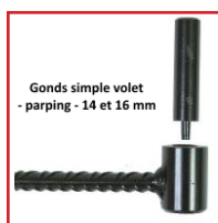
Gonds simple volet - parping - 14 et 16 mm

- Gonds sur platine pour volet simple, idéal pour le bois. Trous fraisés de 7 mm, écart entre la platine et le gonds de 9 mm - Seau de 20 gonds.