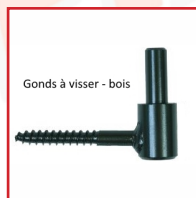
Gonds à visser - bois