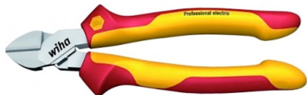
Pince coupante - electric

Longue durée de vie grâce au chromage de la surface de pince qui protège contre la rouille. Articulation spéciale DynamicJoint réduisant la dépense de force lors de la coupe. Pour les fils souples et durs. Modèle Electric : pour les fils à proximité de pièces sous tension jusqu'à 1000 Volt AC. Modèle Classic : tête demi-rondes, style « Suédois » - pour les fils tendres et durs.