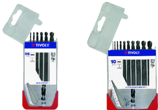
Coffret 6 forêts