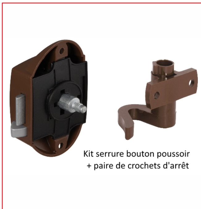
Kit serrure bouton poussoir + paire de crochets d'arrêt