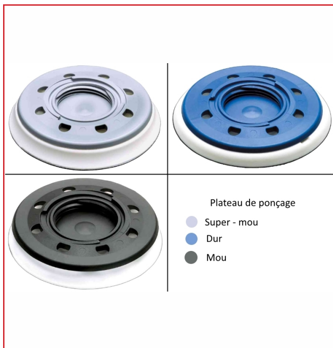
Plateau de ponçage Super - mou Dur Mou