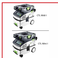
CTL Mini I