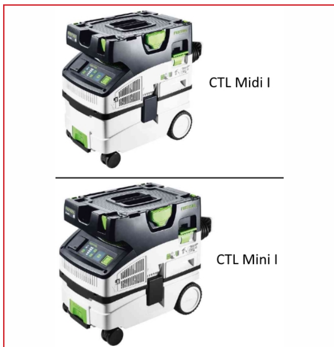
CTL Midi I