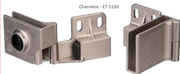
Charnière - ET 5150