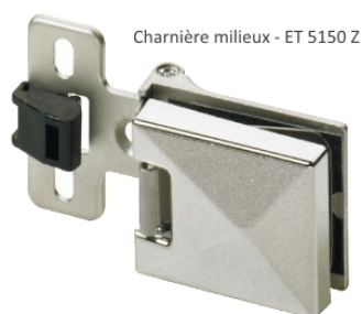
Charnière milieu - ET 5150 Z