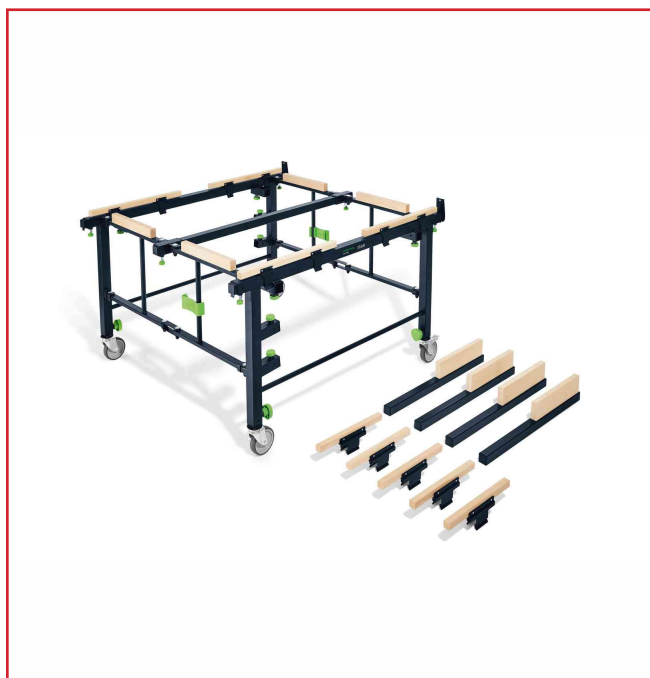
TABLE MOBILE DE SCIAGE ET DE TRAVAIL STM 1800