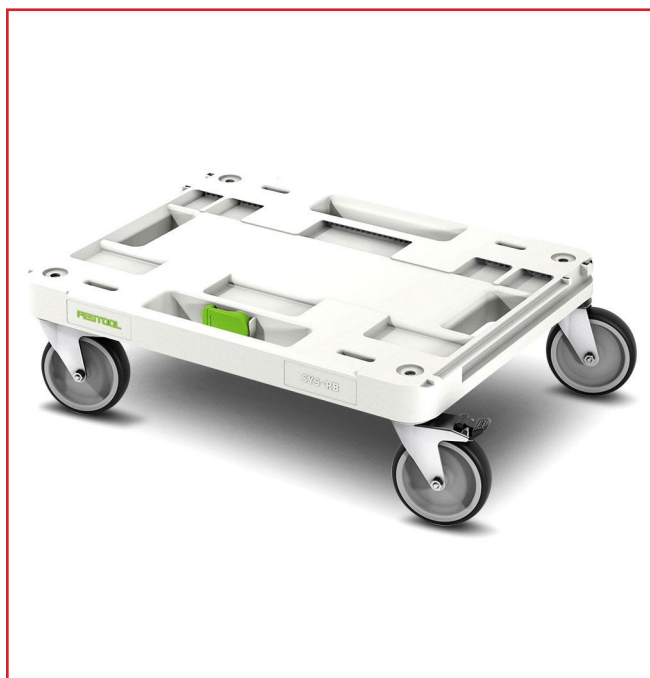
PLANCHE à ROULETTES (ROLLERBOY) SYS-RB